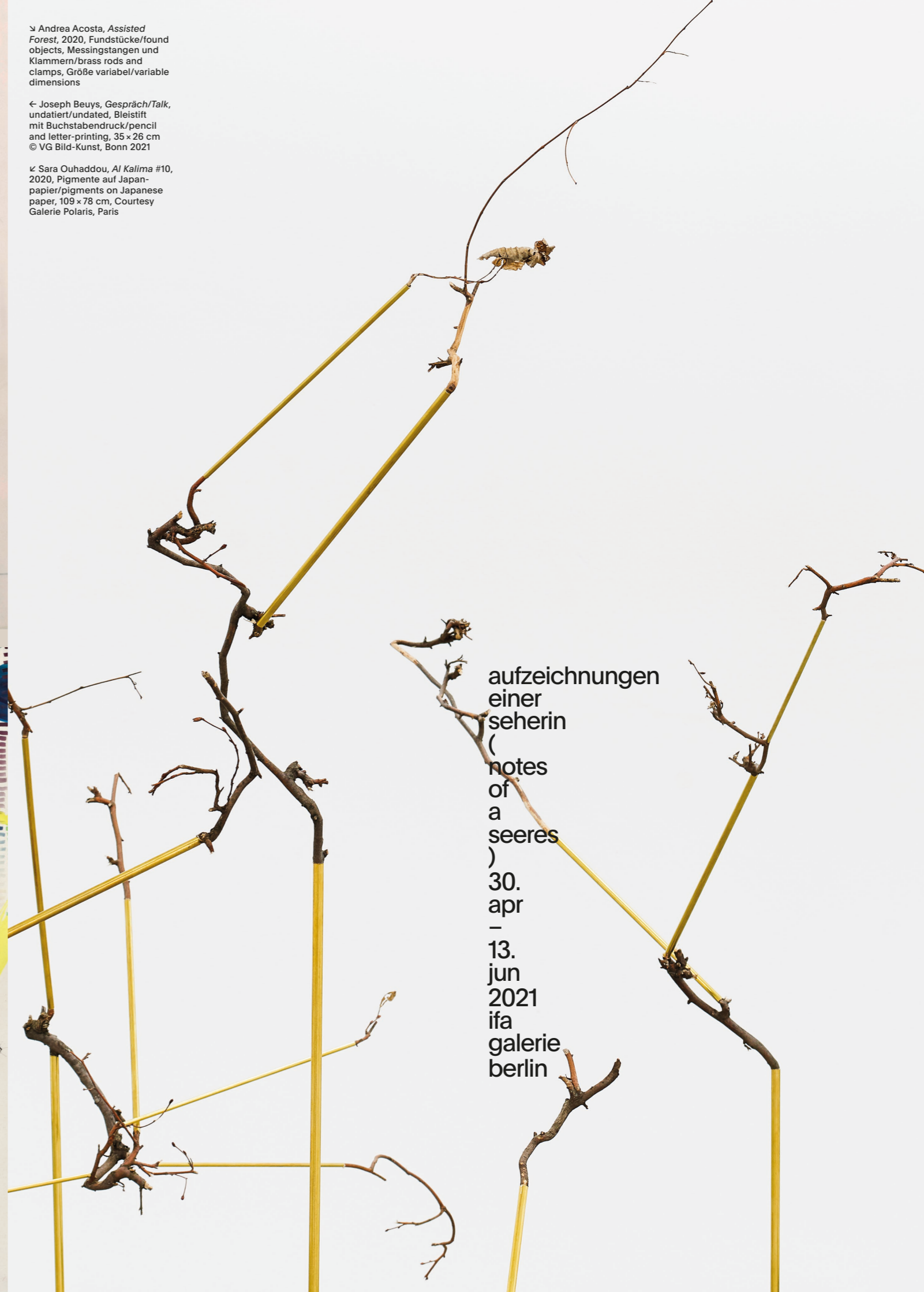
↳ Sara Ouhaddou, Al Kalima #10 , 2020, Pigmente auf Japanpapier/ pigments on Japanese paper, 109 x 78 cm, Courtesy Galerie Polaris, Paris

aufzeichnungen einer seherin ( notes of a seeres ) 30. apr – 13. jun 2021 ifa galerie berlin